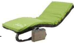
スモールチェンジラグーナ

自動体位変換エアマットレス 「スモールチェンジラグーナ」 やポジショニングピロー を展示致します