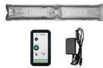
安心プレートセンサー

介護ベッドの「リバティーネオ」や徘徊感知器の 「安心プレートセンサー」を展示致します