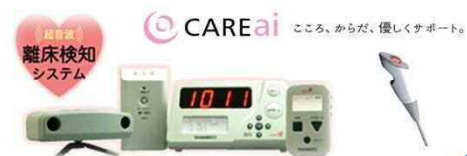
【超音波】 離床検知 システム